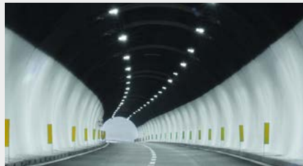
Éclairages de tunnel